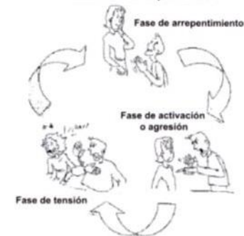
En el ciclo de Violencia hay una serie de fases que suelen ser repetitivas.